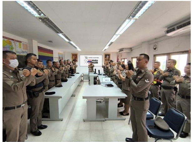
การประชุมกำกับติดตามโดยหัวหน้าสถานีตำรวจ