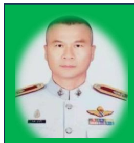
พ.ต.ต.วันชัย รูปแก้ว สว.ป.สภ.तालसुม